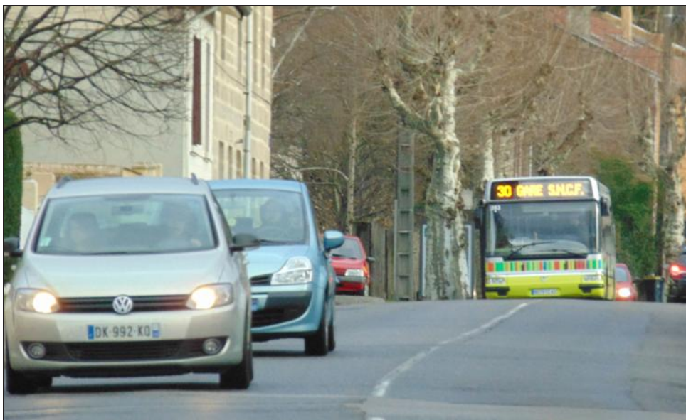
■ Travaux sur le boulevard Fayol : une réunion publique aura lieu jeudi 16 février, à 17 h 30.

Peu de projets sont proposés au vote des habitants de Fayol sur le budget participatif de 2017. En effet, sept seulement ont été retenus, répartis en deux grandes catégories, voirie et sécurité d'une part et cadre de vie d'autre part. Le maire, Marc Petit, a rappelé qu'une fois choisis, les projets étaient