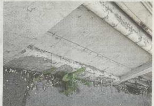
■ Une rue appelouse jonchée de mégots de cigarettes.

trois seaux de canettes dans le jardin public de Sous-Paulat. Aujourd'hui, ce citoyen lambda est ulcéré « de voir sa ville se dégrader sans que personne ne fasse rien. J'ai interpellé le maire ou ses services à plusieurs reprises. On me dit de faire remonter les problèmes au conseil de quartier. Le maire parle de démocratie participative, mais au quotidien, rien ne bouge » s'agace-t-il.