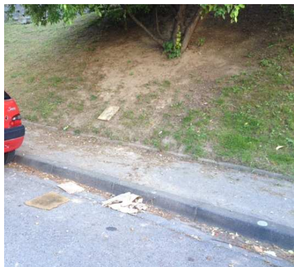
④ Square au bord du bd fayol – Le 02/06/2015