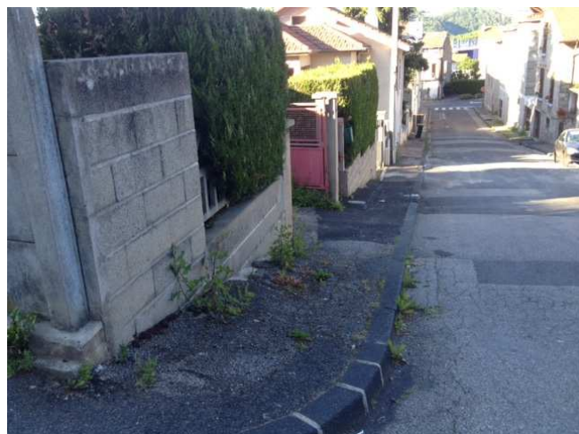
③ Chemin du Beal – Le 02/06/2015