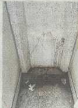
■ L'urinoir situé place de la Rochette.